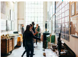
z.B.: Alte Spinnerei