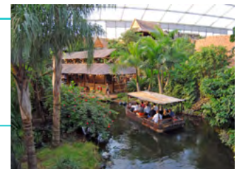
z.B.: Zoo Leipzig